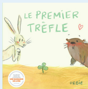
Le premier trèfle Orbie 2024