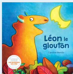
Léon le glouton Caroline Merola 2025