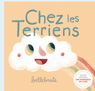
Chez les terriens Bellebrute 2020