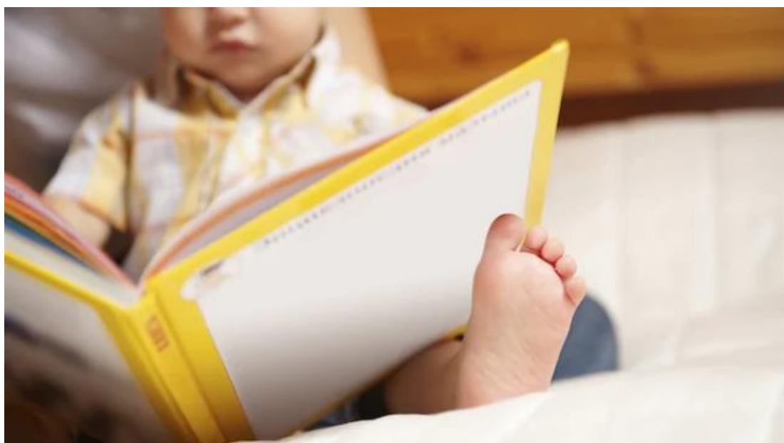
Un enfant lit un livre

Les parents qui souhaitent initier leurs enfants âgés de moins de 1 an à la lecture pourront se procurer la trousse du parfait bébé-lecteur dans les bibliothèques de la région.